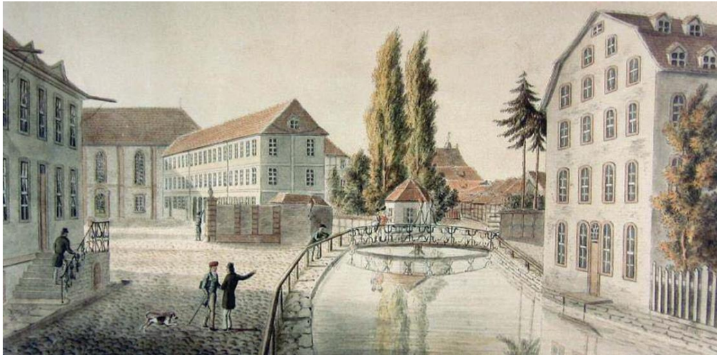
Königlich Academisches Museum, 1773